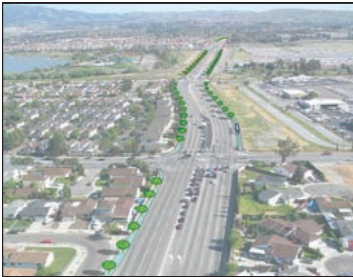
Bahagi 1 – Mga Pangkaligtasang Pagpapahusay sa Capitol Expressway para sa Naglalakad

Kasama ang pagpapaganda para sa mga pedestrian at mga bus sa kahabaan ng Capitol Expressway na madadaan ng mga pedestrian at nagpapahusay ng kaligtasan. Ang bahaging ito ay natapos noong Fall 2012 at kasama dito ang mga bagong sidewalk, ilaw sa kalye, at landscaping sa pagitan ng sidewalk at kalsada mula sa Capitol Avenue hanggang Quimby Road.