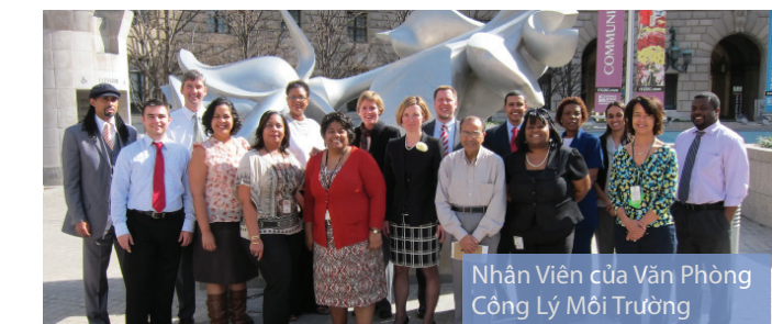
Nhân Viên của Văn Phòng Công lý Môi trường

Văn phòng Công lý Môi trường, trước đây là có tên là Văn phòng Bình đẳng Môi trường, được thành lập vào năm 1992, nhiệm vụ chính của Văn phòng là điều phối các nỗ lực của tổ chức để đưa các vấn đề cần xem xét về công lý môi trường vào tất cả mọi chính sách, chương trình, và hoạt động của tổ chức EPA. OEJ tạo quyền cho các tổ chức liên quan giải quyết trên tinh thần xây dựng và phối hợp các vấn đề công lý môi trường. Văn phòng cũng xây dựng quan hệ đối tác với các chính phủ và tổ chức địa phương, tiểu bang, bộ tộc, và liên bang để tạo dựng được các cộng đồng khỏe mạnh và bền vững.