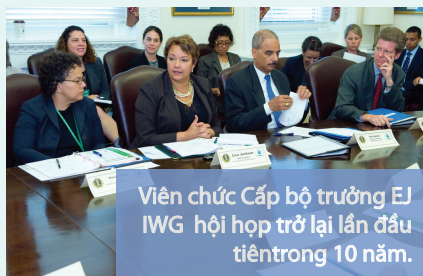
Viên chức Cấp bộ trưởng EJ IWG hội họp trở lại lần đầu tiên trong 10 năm.

Diễn đàn làm hồi sinh lại hoạt động môi trường liên bang theo chương trình EO 12898 ở cấp Quản lý và dẫn đến việc trao đổi thông tin hiệu quả giữa các cơ quan liên bang và các nhà vận động công lý môi trường bên ngoài.