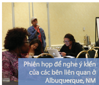
Phiên họp để nghe ý kiến của các bên liên quan ở Albuquerque, NM