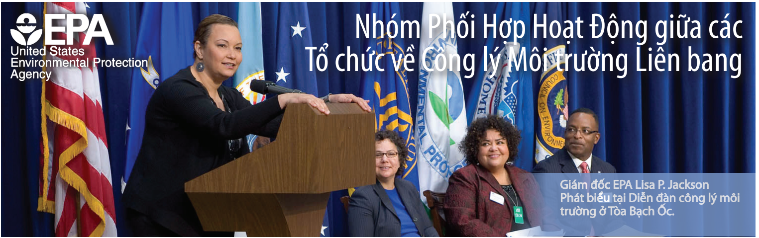
Giám đốc EPA Lisa P. Jackson Phát biểu tại Diễn đàn công lý môi trường ở Tòa Bạch Ốc.